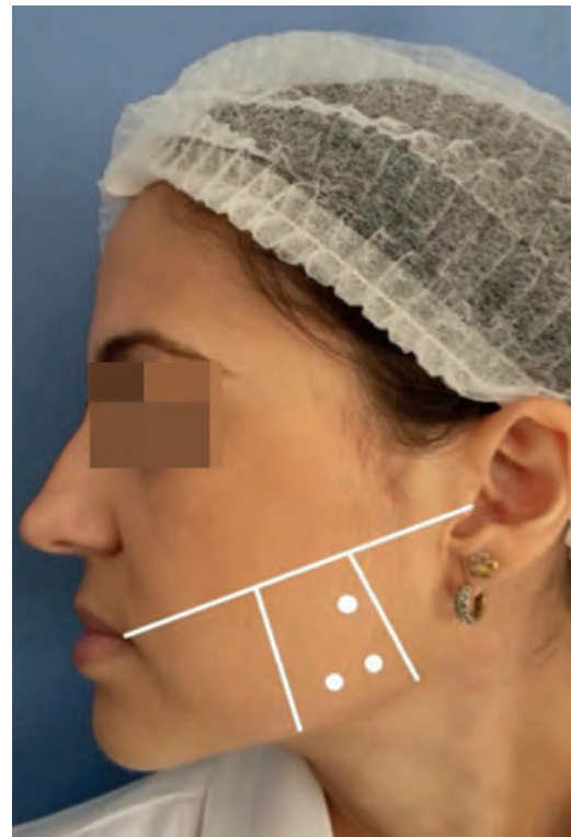
FIGURA 2: pontos de aplicação da BoNTA

Na maioria dos estudos, esse pico máximo de efeito também coincidiu com o período de maior satisfação por parte dos pacientes. A faceta positiva é que existe um intervalo de tempo entre a recuperação da função e do volume muscular. A ação do músculo retorna a partir de 12 semanas depois, com seu volume recorrendo apenas após 16 semanas. Além disso, o tempo necessário para recuperação do volume muscular aumenta de acordo com a idade dos pacientes. E, embora a atrofia das fibras seja reversível e temporária, o volume do músculo parece não retornar ao estado anterior ao tratamento, mesmo após completa recuperação de sua função posterior