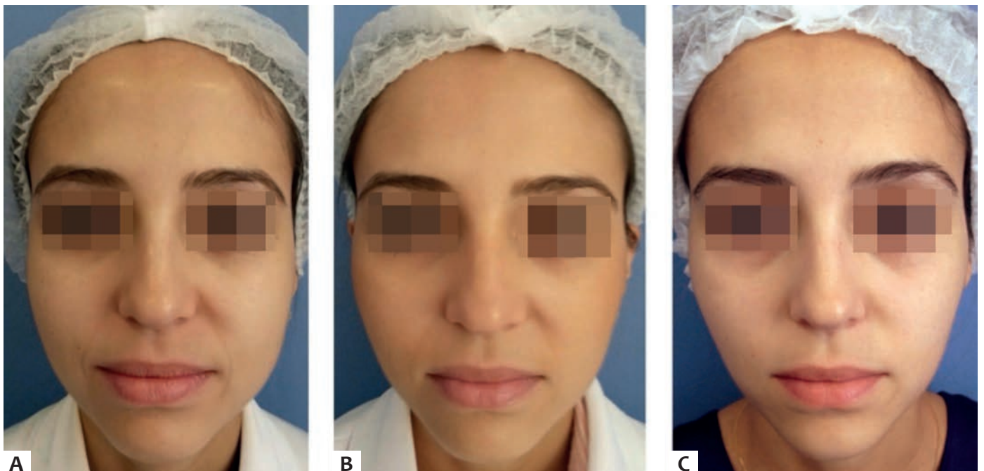
FIGURA 3: (a) pré-tratamento (b) três meses após aplicação (c) seis meses após, com afinamento do terço inferior

Assim como relatado na literatura, um dos efeitos secundários do tratamento foi a diminuição da amplitude do sorriso, devido à proximidade do músculo risório no raio de ação da toxina durante a aplicação (Figura 5).