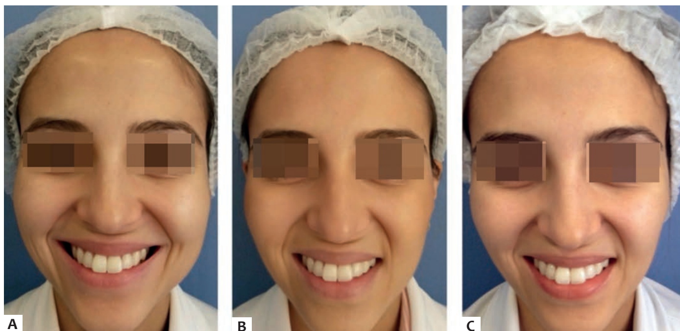
FIGURA 5: (a) pré-tratamento (b) três meses após a aplicação, com redução da amplitude do sorriso e assimetria; (c) após seis meses, com melhora da amplitude do sorriso e afinamento do contorno do terço inferior